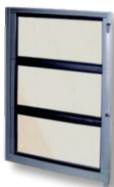
Châssis d'amenée d'air

Possibilité de commander les amenées d'air frais type portes automatiques ou châssis d'amenée d'air