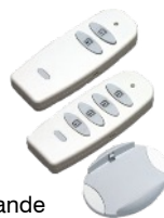
Télécommande en option

Possibilité de commander les amenées d'air frais type portes automatiques ou châssis d'amenée d'air