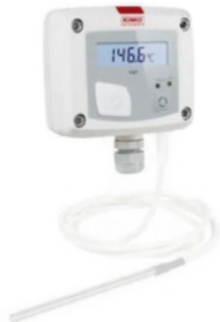
Sonde température extérieure