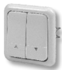
Bouton de commande manuelle