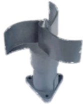
Détecteur de vent