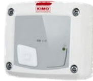
Détecteur de gaz CO