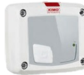
Détecteur de gaz CO 2